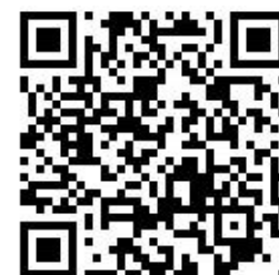
衛生福利部志願服務系統 QR CODE